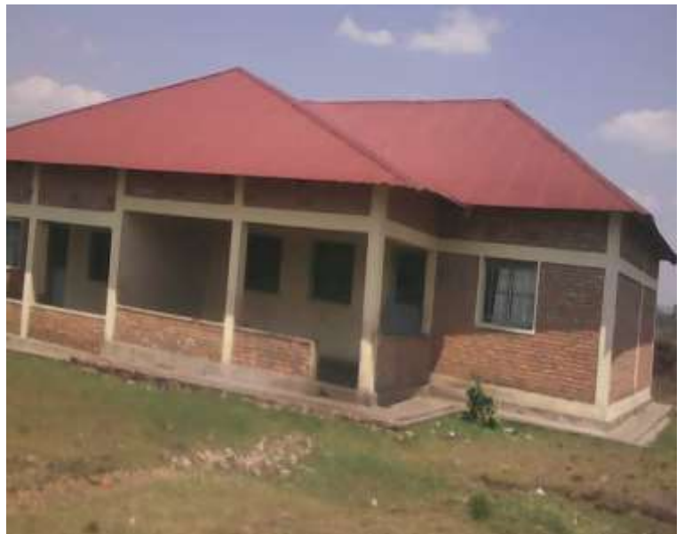
Photo : Home pour le personnel enseignant

Les infrastructures du home pour enseignants comprennent 2 blocs mitoyens de 3 chambres chacun et un salon commun dans chaque bloc : un bloc pour femmes et un bloc pour hommes. Un bloc cuisine indépendant a également été construit.