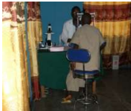
L'examen chez l'ophtalmologue