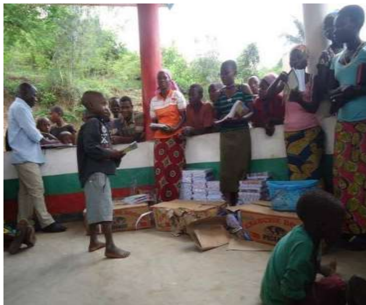
Dons des cahiers à l'école fondamentale (Ecofo Buhayira)

L'école est située dans la Commune Isare, Province de Bujumbura. Eduaf Luxembourg soutient l'association « Turemeshe impfuyi » depuis 2008 par la fourniture d'équipements pédagogiques et les frais de fonctionnement. Le projet le plus important est la construction et l'équipement de 6 salles de classe, en 2011.