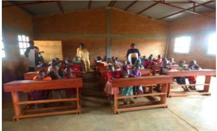
Photo : Une salle de classe à Ecofo Jenda

Elle se trouve dans la Commune de Songa, Province Bururi, Burundi. L'école a bénéficié de trois salles de classes équipées et de latrines. Par ailleurs, EDUAF Luxembourg collabore avec la Fondation Rufyiri des Etats Unis d'Amérique, pour fournir des équipements pédagogiques et d'hygiène aux élèves vulnérables.