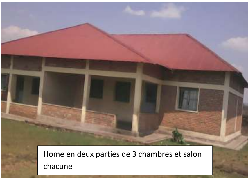
Photo : Home pour le personnel enseignant

Un bloc cuisine indépendant a également été construit.