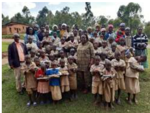
Photo : Dons du matériel scolaire et produits d'hygiène aux élèves vulnérables à Ecofo Kivumu