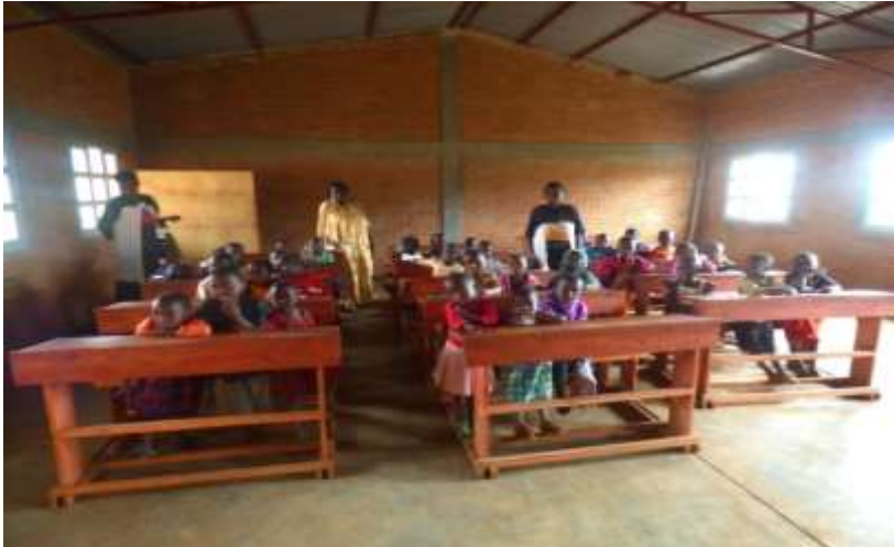
Photo : Une salle de classe à Ecofo Jenda. Les mamans portent leur bébé au dos lors des cours par manque de crèches.

Elle se trouve dans la Commune de Songa, Province Bururi, Burundi. L'école a bénéficié de trois salles de classes équipées construites par Eduaf et de latrines. Par ailleurs, EDUAF Luxembourg collabore avec la Fondation Rufyiri des Etats-Unis d'Amérique, pour fournir des équipements pédagogiques et d'hygiène aux élèves vulnérables.