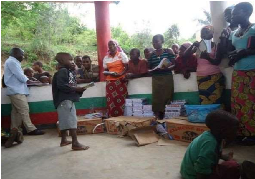
Dons des cahiers à l'école fondamentale (Ecofo Buhayira)

L'école est située dans la Commune d'Isare, Province de Bujumbura Rural. Eduaf Luxembourg soutient l'association « Turemeshe impfuyi » depuis 2008 par la fourniture d'équipements pédagogiques et les frais de fonctionnement. Le projet le plus important est la construction et l'équipement de 6 salles de classe, en 2011.