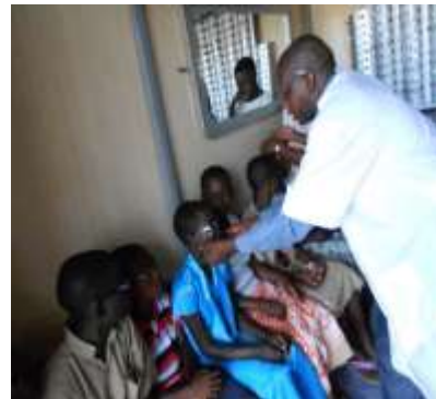
Remise de lunettes