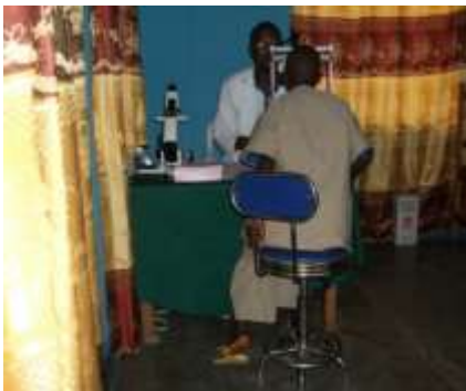
L'examen chez l'ophtalmologue